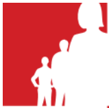
Slika 3. Udio cijepjenih prema dobnim skupinama